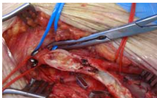
Leistenschlagader mit Stenose und Thrombus